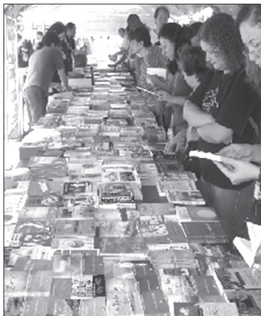
Vista geral da FLE, no Calçadão da Antonio Agu

Durante os sábados de abril e o primeiro sábado de maio, a 27ª Feira do Livro Espírita de Osasco vendeu mais de 3.000 livros a espíritas e simpatizantes. O evento aconteceu das 8 às 18 horas. A promoção foi da USE Municipal de Osasco.